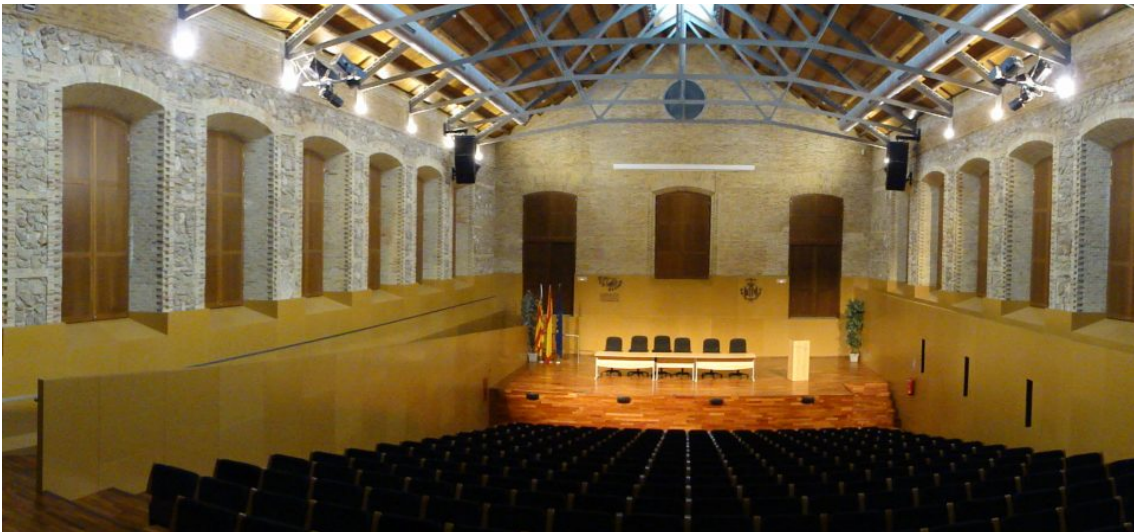
Salón de actos