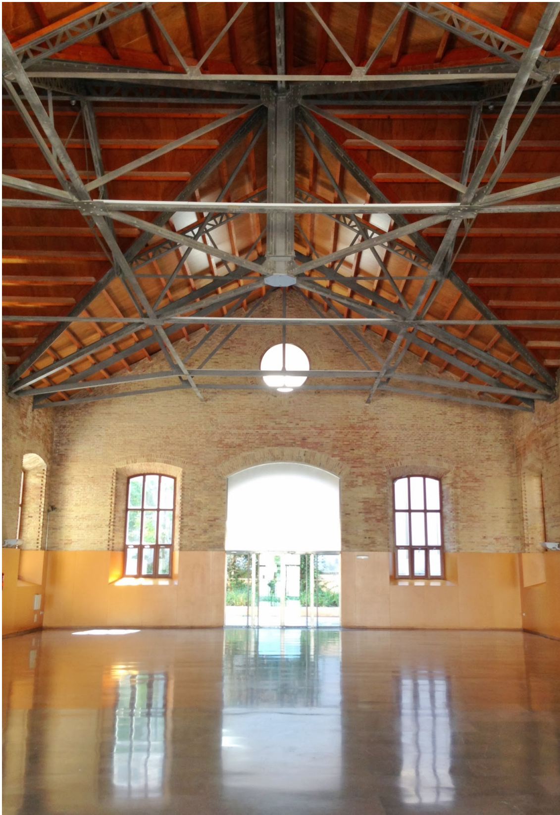
Hall de entrada para exposición comercial y almuerzo