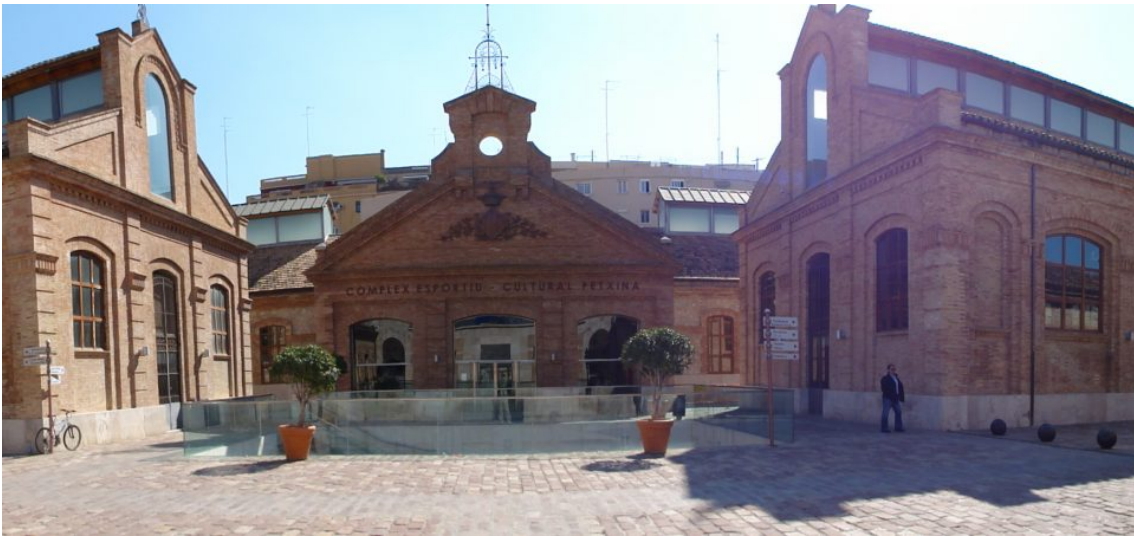
Acceso al recinto

ACADEMIA ESPAÑOLA DE NUTRICIÓN Y DIETÉTICA